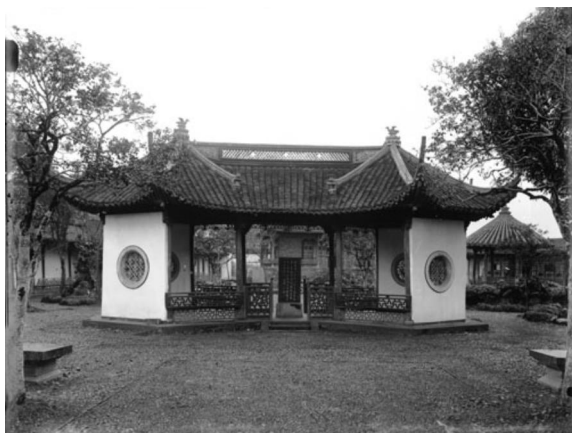
竹素园内的中心建筑临花舫。（弗利尔，1911）

正是在1911年2月12日上午游览曲院风荷之时，弗利尔从上海雇用的两位随行中国摄影师拍摄下了反映竹素园完整全貌的珍贵照片。说起这批照片的辨认过程，本身也是一个有趣的故事。弗利尔艺术馆档案部所收藏的这批照片是玻璃底板的负片，照片本身并无说明文字。档案部主任戴维·霍格先生曾经请专家帮他辨认过弗利尔所拍摄的中国照片，当时这批照片被指认为是杭州的西泠印社。但是本文作者看到照片之后，确认它们并非西泠印社。由于这批照片显然是在西湖边的平地上拍摄的，所以任何熟悉杭州孤山的本地人都不会认可这就是西泠印社的说法。那么它们所反映的究竟是杭州哪个景点呢？一个个比对过来，它们似乎又跟杭州现有的任何一个公园都对不上号。所以在很长一段时间内，这些照片的拍摄地点都未能真正得到确认。