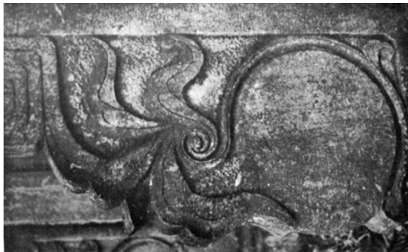
明代古墓四周所铭刻的 浮雕花纹。（艾格纳，1935）

显然，艾格纳所描述的明代古墓很可能就是明代骠骑将军严德的坟墓，而上面照片中守卫神道的那位威风凛凛的武将很可能就是代表着墓主，即明代骠骑将军严德本人。