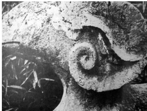
守卫神道的一只石雕羊。 （艾格纳，1935）