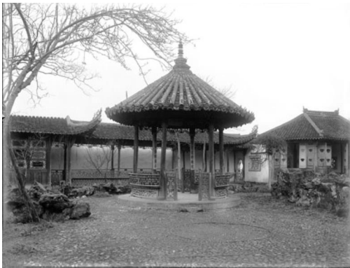
竹素园内的流觞亭。(弗利尔, 1911)

缺口首先是从竹素园“临花舫”那张照片打开的。有一次在翻阅杭州二我轩照相馆的西湖旧相册时, 本文作者偶然发现其中有一张照片跟弗利尔杭州照片中的几张有点相似。经过仔细比对和广泛的背景调查, 最后终于可以确认这张照片所表现的正是现已改头换面了的杭州竹素园。这个突破口一旦找到之后, 其余几张照片的身份辨认便势如破竹, 使神秘的谜团逐一得到了破解。