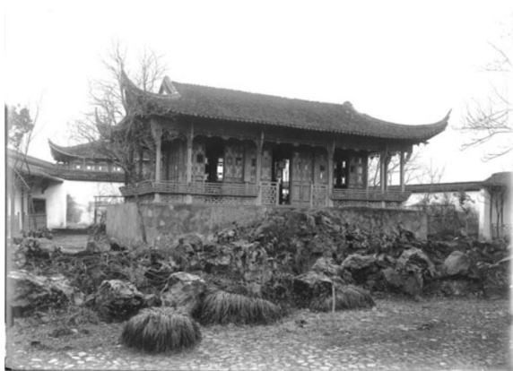
竹素园的水月亭。(弗利尔, 1911)

然而，竹素园中建筑风格最漂亮的非聚景楼莫属。这也是一座歇山顶的楼榭，但是没有脊樑，屋檐细长上翘，飘逸欲仙。厅堂正面是一长排黑白相间的窗格门，窗格花纹整齐而细腻，宛如一幅工笔水墨画。外廊全部都有锁链花纹的靠背长椅围住，正门外还有装饰性的两个门格，精致大气，颇为养眼。这是所有竹素园照片中唯一看不到对联的厅堂。运用反证法，正好也能认定它就是聚景楼。