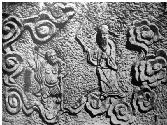
坟墓上所刻八仙过海图中 两位神仙的浮雕。（艾格纳，1935）

从上页的第一张照片中，我们可以隐约看到，在陵墓的南面有一条神道，神道两边是守墓的武将和其他石雕动物。人像的脸部五官比例匀称，神情兼备，动物石像也刀法纯熟，线条简练，呼之欲出。在神道的尽头则是一个石牌坊，以作为陵墓的大门。此外，在坟墓四周雕刻的那些装饰性花纹也都颇具功力，具有较高的工艺和艺术水平。所有这些石雕作品都能够反映出杭州古时工匠的手艺和建筑水准。