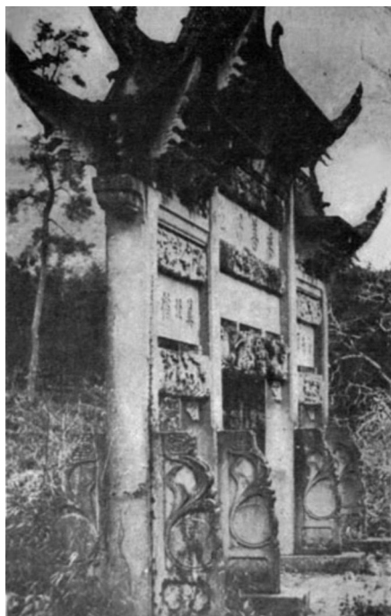
位于神道尽头的石牌坊，上面也雕刻着精美的浮雕。（艾格纳，1935）

艾格纳在文章中并没有说明他所见陵墓的主人是谁，但他特意点明自己所描述的是一个明代古墓。这一线索使得我们可以进一步到地方志中查询墓主。1922年重修并刻印的《杭州府志》列出了杭州的219个明代冢墓，其中钱塘县191个，仁和县28个；然而位置在灵隐寺旁边的明代古墓却只有下面这一个：