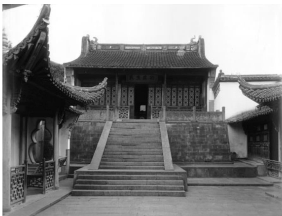
竹素园的湖山春社。(弗利尔, 1911)

竹素园里还有一座外形式样与聚景楼相似，但窗格花纹不同，而且是建在高台上的楼榭。园内的流觞小溪逶迤地从它前面的假山之间缓缓流过。仔细观察，可以看到它的大门两旁挂有两个长对联：