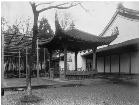
竹素园的观瀑亭。(弗利尔, 1911)