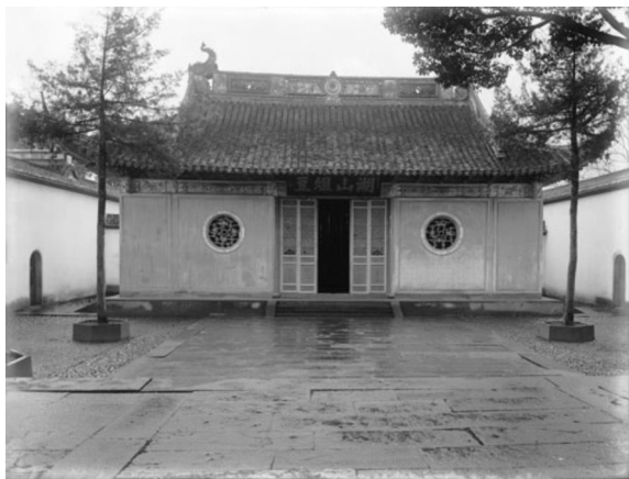
竹素园的泉香室。（弗利尔，1911）

查证竹素园楹联文本，我们立刻就对这副短小的楹联肃然起敬：原来这居然是雍正皇帝御笔题写的对联。不过木排上隐约可见的落款显示，这几个字并非雍正皇帝的真迹，而是光绪年间某位文人雅士重新抄录的笔迹。