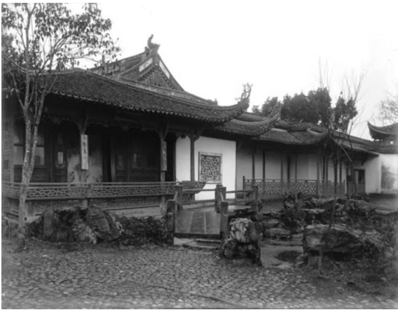
竹素园内雍正皇帝题写的对联。(弗利尔, 1911)

再来看上面这张照片, 它展示了一个典型的江南庭院的一角: 凉亭、带围栏的走廊、镂空的浮雕窗饰、小溪、假山和小桥。不可忽略的是, 凉亭柱子上也挂有写有一副对联的木牌: