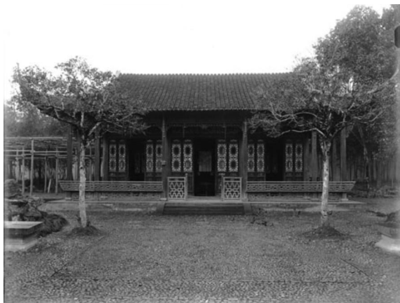
竹素园的聚景楼。

然而，竹素园中建筑风格最漂亮的非聚景楼莫属。这也是一座歇山顶的楼榭，但是没有脊樑，屋檐细长上翘，飘逸欲仙。厅堂正面是一长排黑白相间的窗格门，窗格花纹整齐而细腻，宛如一幅工笔水墨画。外廊全部都有锁链花纹的靠背长椅围住，正门外还有装饰性的两个门格，精致大气，颇为养眼。这是所有竹素园照片中唯一看不到对联的厅堂。运用反证法，正好也能认定它就是聚景楼。