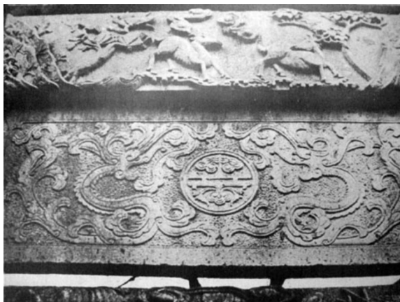
石牌坊上的二龙戏珠和雌雄 逐鹿的浮雕图案。（艾格纳，1935）