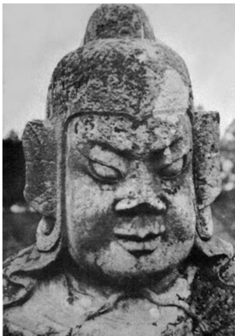
守卫神道的武将很可能就是墓主本人的石雕像。（艾格纳，1935）