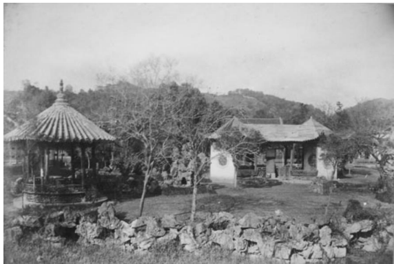
杭州竹素园。(1912)