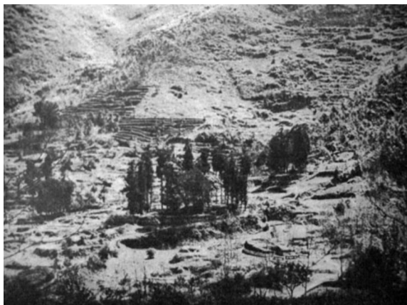
位于灵隐寺后面的山谷。被高大松树所环绕的就是明代古墓的所在地。

环境，墓地方位和牌坊、人物和动物雕像，以及坟墓上的各种浮雕装饰图案栩栩如生地展现在读者面前。虽然老照片的清晰度并不是很高，但其所代表的古代中国石雕作品的艺术魅力和震撼力却是毋庸置疑的。