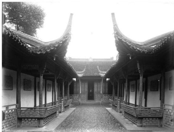
竹素园的十二花神廊。（弗利尔，1911）

还有一张照片表现一个歇山顶的殿堂，面宽五间，脊樑很高，两端分别有雷公柱连吻樑。脊樑上用的瓦条和统花砖做工精致，图案美观，脊樑中央还镶嵌有一个类似于镜子的照胆台。这究竟又是一个什么样的厅堂呢？照片中唯一的线索就是大门之上、屋檐之下的那块牌匾，上面有大字书写着“湖山俎豆”四个大字。沿着这一线索，我们也在《竹素园楹联选》中查到了下面这首诗：